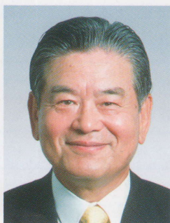
コメンテーター 川淵 三郎 東京都教育委員 日本サッカー協会 名誉会長